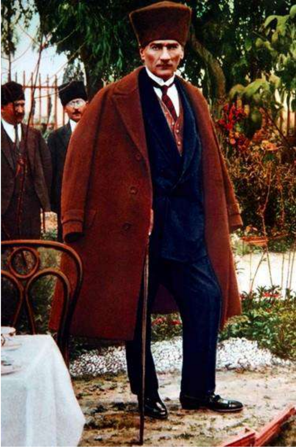
- Mustafa Kemal ATATÜRK Tarsus Şelalesinde

Eğitimidir ki, bir milleti ya özgür, bağımsız, şanlı, yüksek bir topluluk halinde yaşatır; ya da esaret ve sefaletle terk eder.